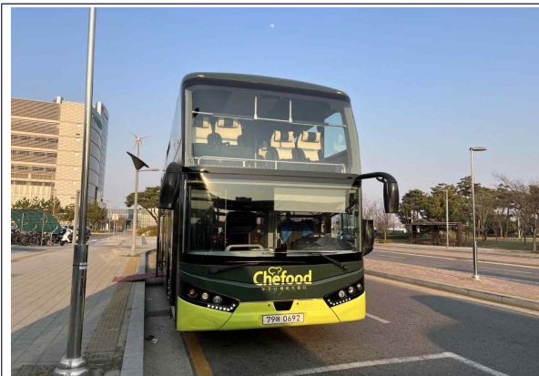
‘셰푸드 버슬랭’ 버스