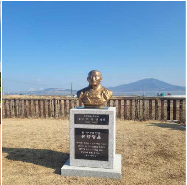
□ 강화군 교동면 송암박두성 생가복원