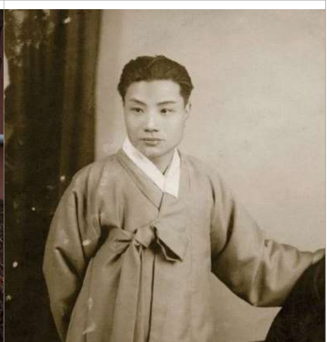
□ 중구 우현 고유섭