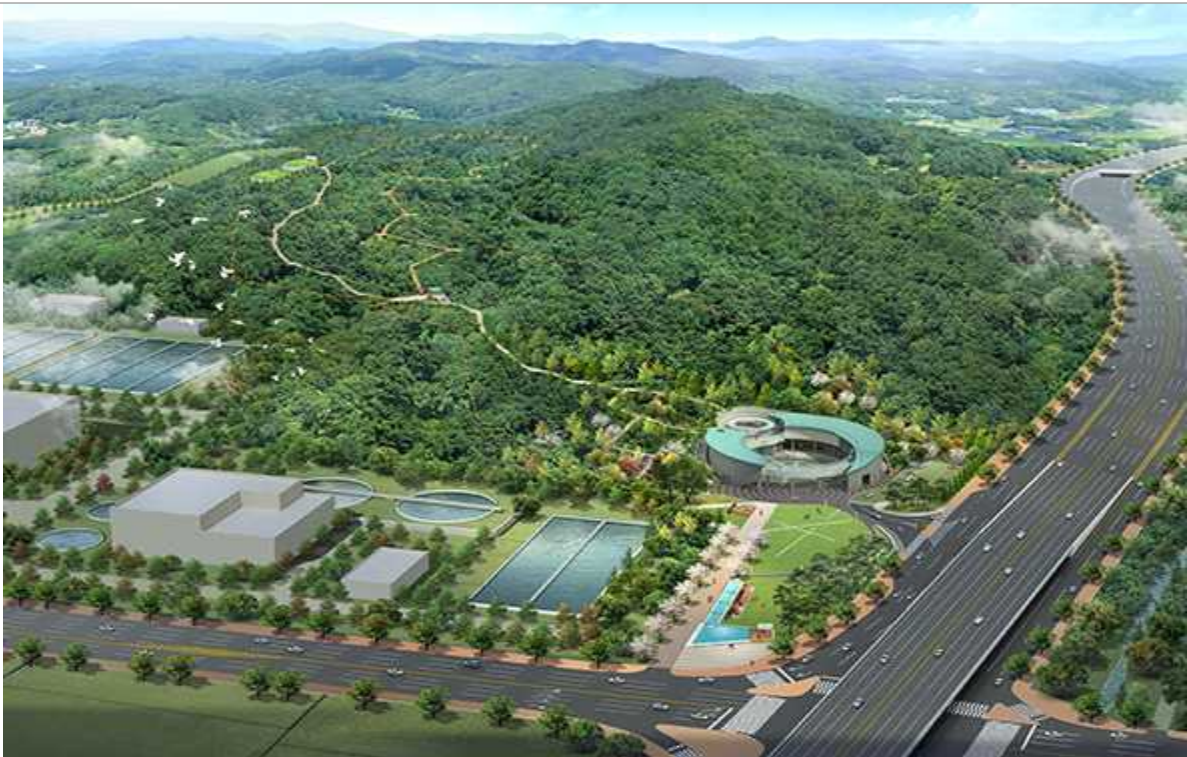
□ 남동구 이승훈 역사공원(조성중)