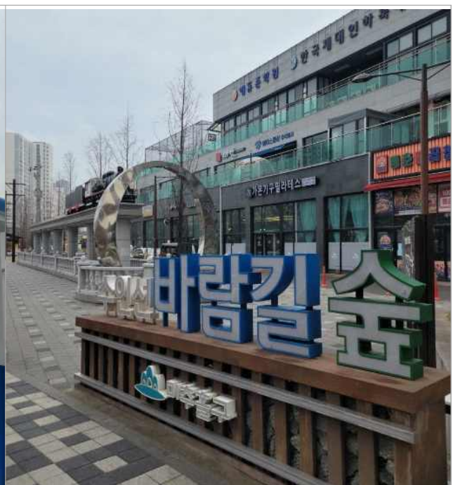
□ 미추홀구 수인선바람길숲