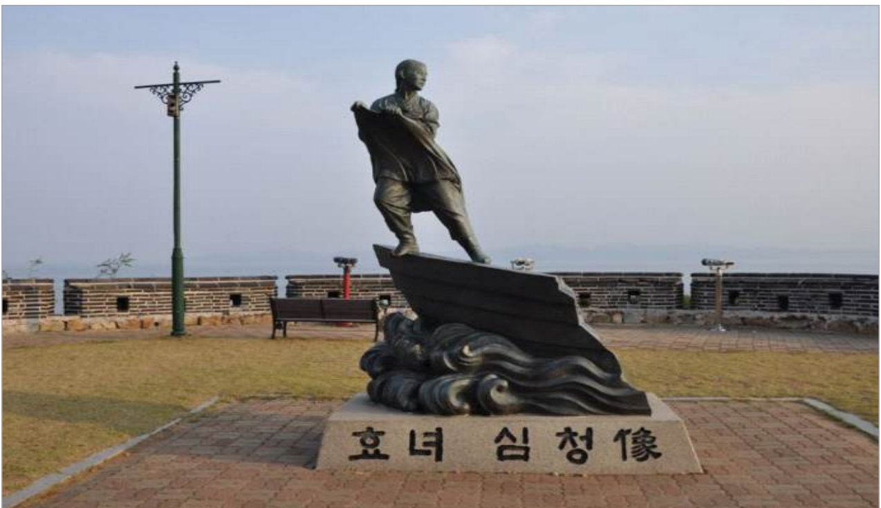
□ 옹진군 효녀 심청각