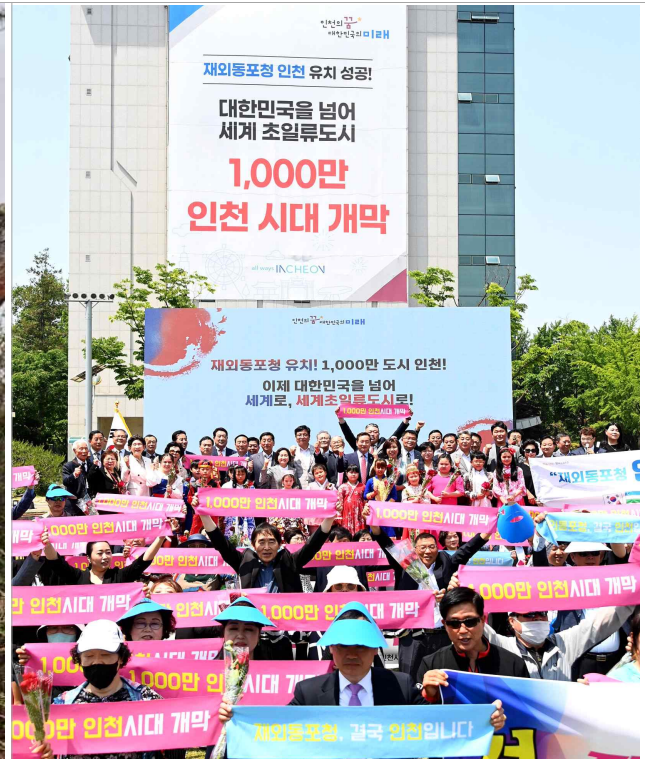
□ 연수구 윤영하소령, 재외동포청개청