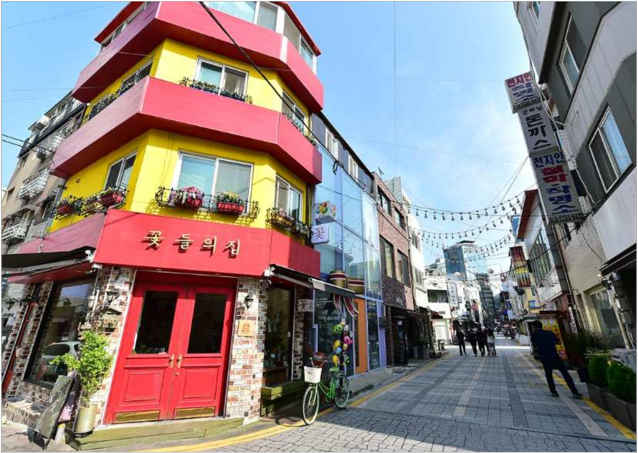
□ 부평구 평리단길