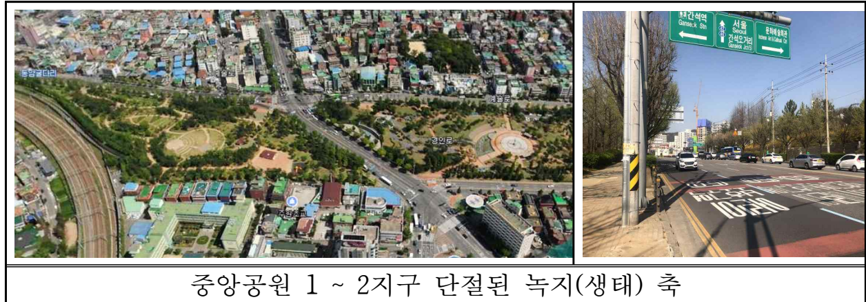
중앙공원 1 ~ 2지구 단절된 녹지(생태) 축