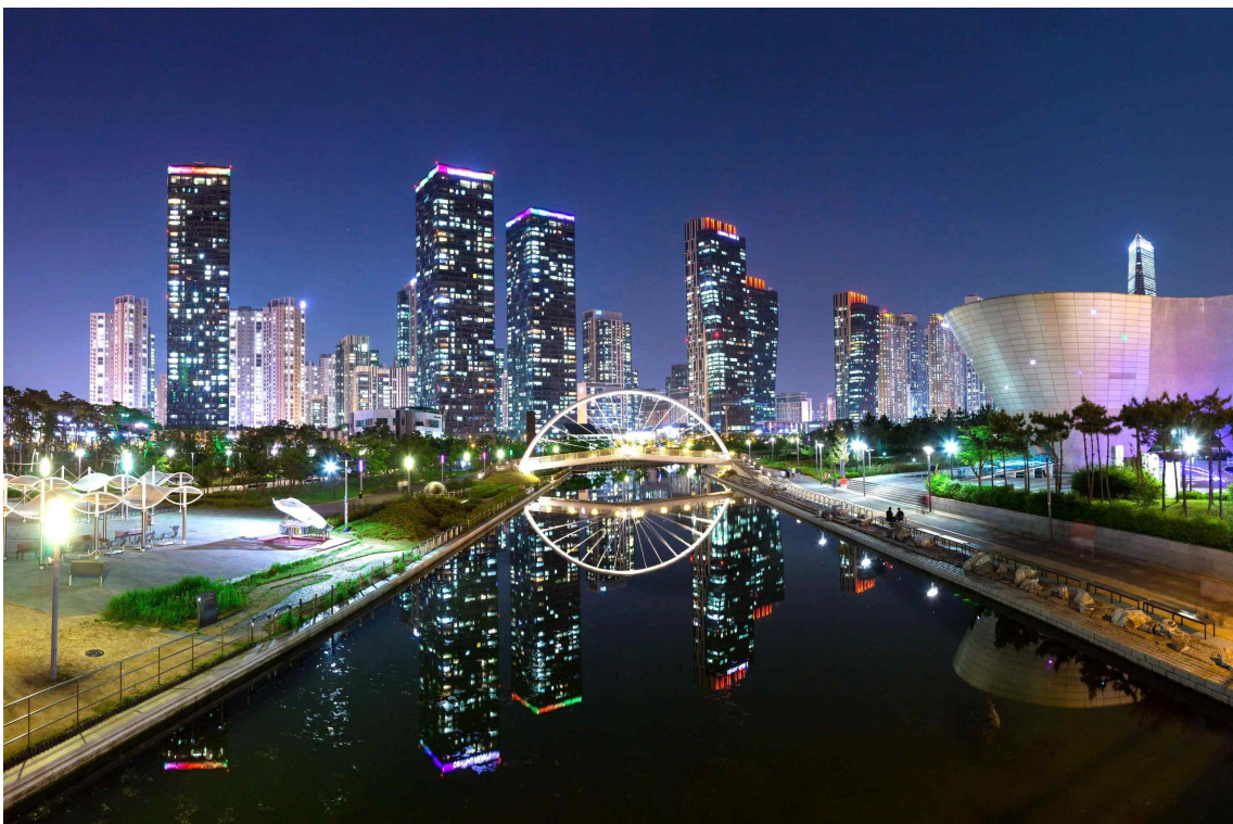
〈G타워에서 바라본 송도센트럴파크〉