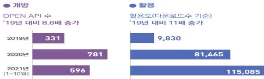
<공공데이터 개방 및 활용>