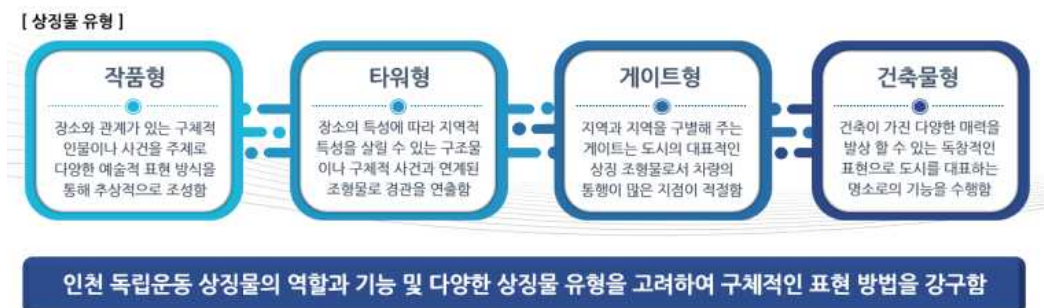
[그림 6-2] 상징물 적용 방안 제시