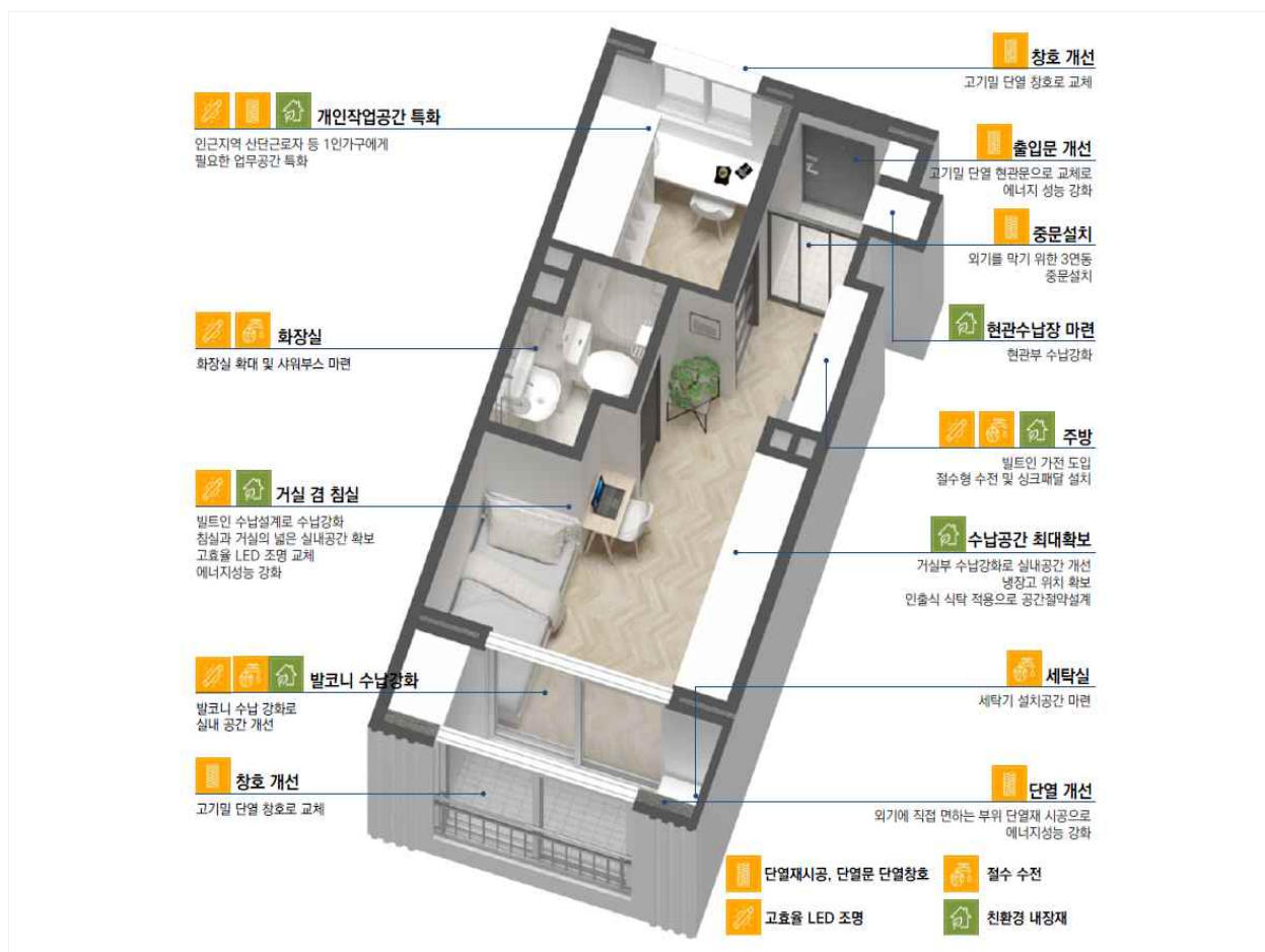
선학 영구임대주택 : 세대내부 주요 개선방향