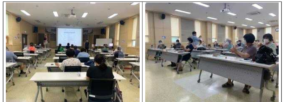
2020년 농촌교육농장 교사양성과정