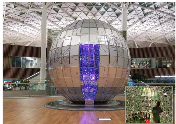
인천공항공사 노드 정원(동, 서측) “꿈꾸는 공간 I, II”