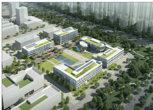
< K-바이오 랩허브 조감도 >