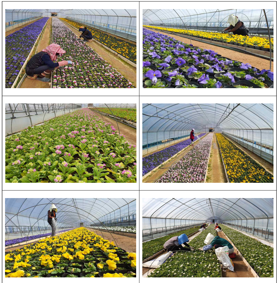
<붙임> 봄 초화 재배 사진

한편 계양공원사업소는 양묘장을 운영을 통해 매년 약 백만 본 이상의 계절별 초화를 생산·공급함으로써 지역일자리 창출 및 예산절감의 효과를 얻고 있다.