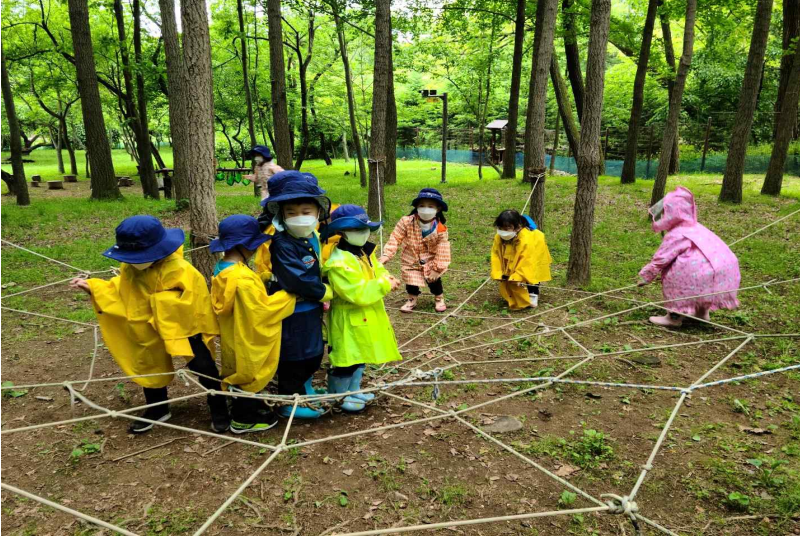
○ 유아숲 체험 운영 프로그램 참여사진