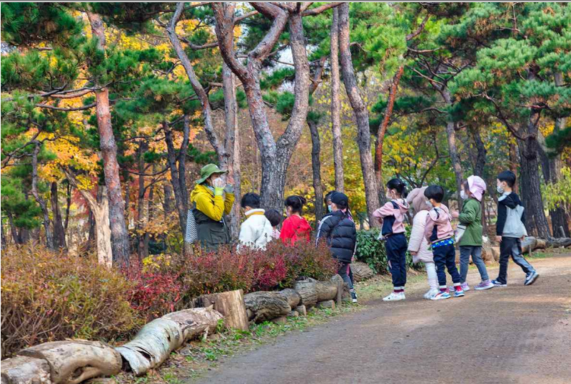
○ 숲해설 체험 운영 프로그램 참여사진