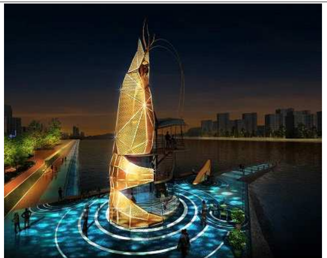
소래지역수변 야간경관 개선사업(2022)