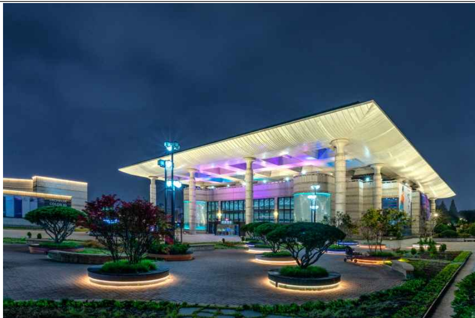
인천문화예술회관 외관 사진