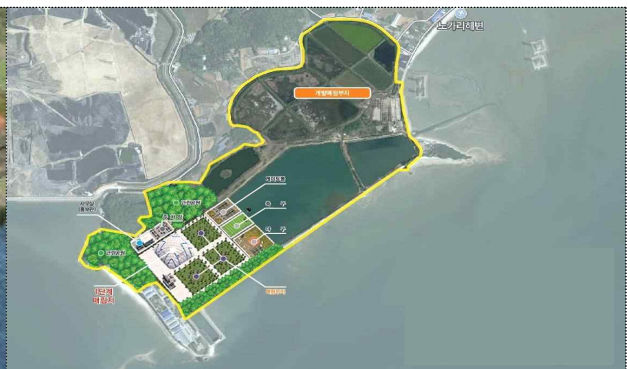
부지 개발 개요도