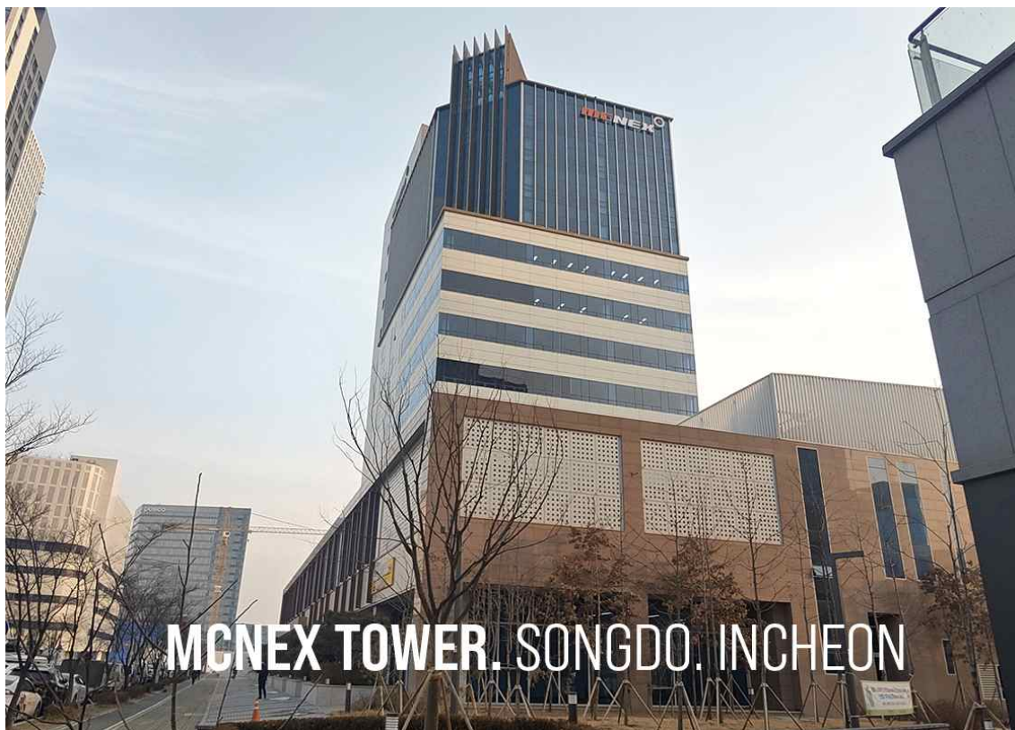
(주)엠씨넥스 송도사옥(본사) 전경 사진