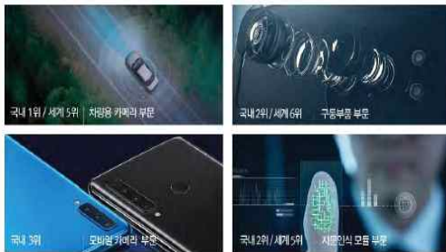
<분야별 국내외 점유율>