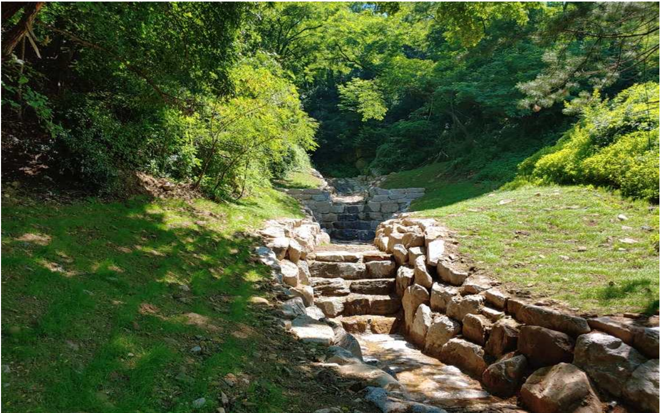
〔사진. 미추홀구 학익동 문학산 일원(2021년 사방사업 시공)〕