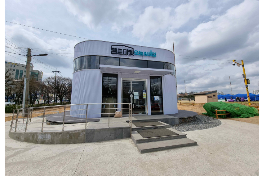
(캠프마켓 인포센터 '캠프마켓 오늘&내일')