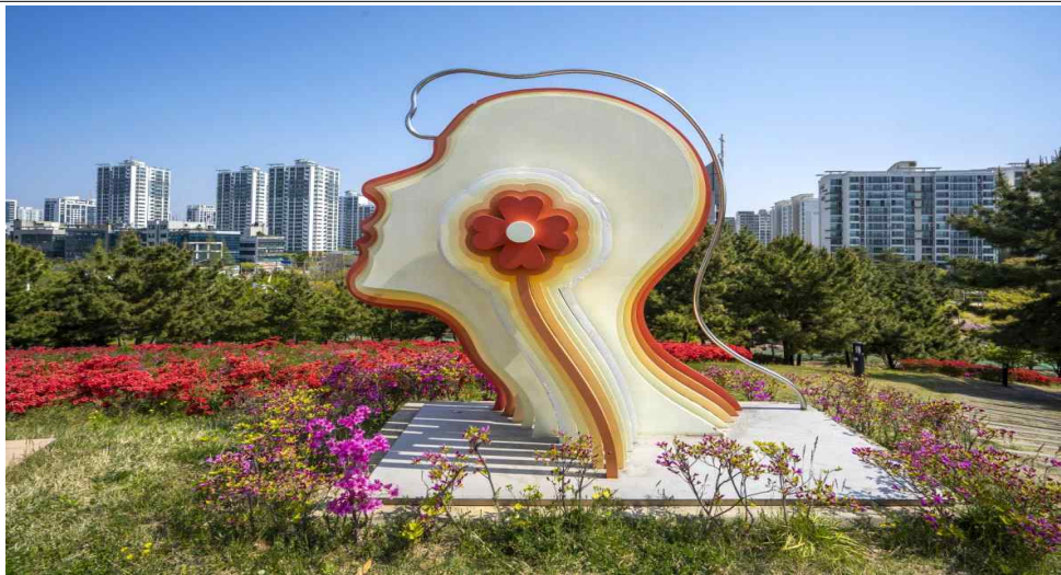
기다림은 꽃으로 피다(해돋이 공원)