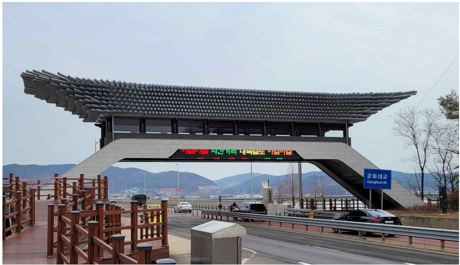
강화대교 관문 상징조형물