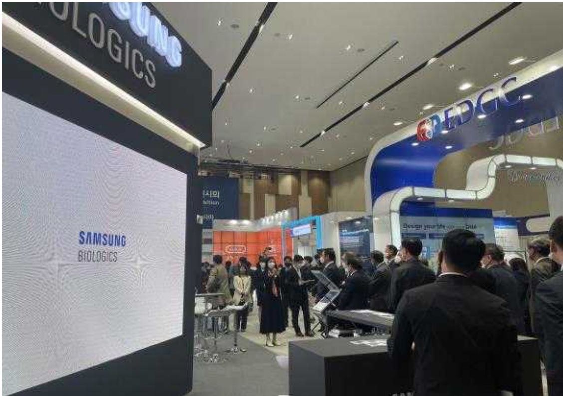
[참고이미지] 2021 바이오·제약 인천 글로벌 콘펙스(Big C 2021) - 국제바이오제약전시회 전경