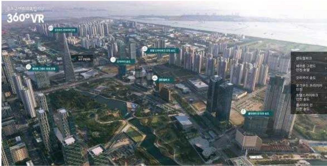
[참고이미지] 송도국제 회의복합지구 360° VR 전경