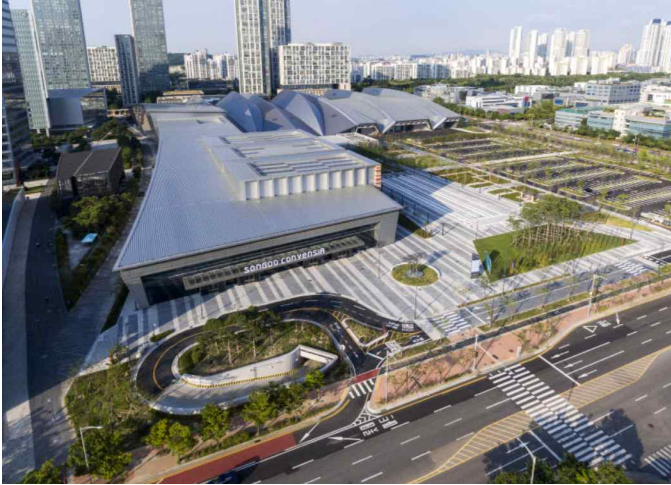
〈사진〉 송도 컨벤시아 전경