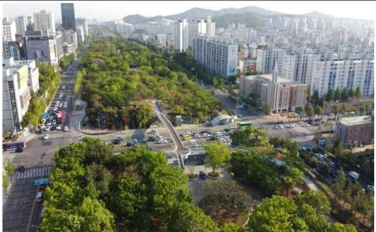
보행육교(3-4지구) [월운교] 인천시청역 사거리