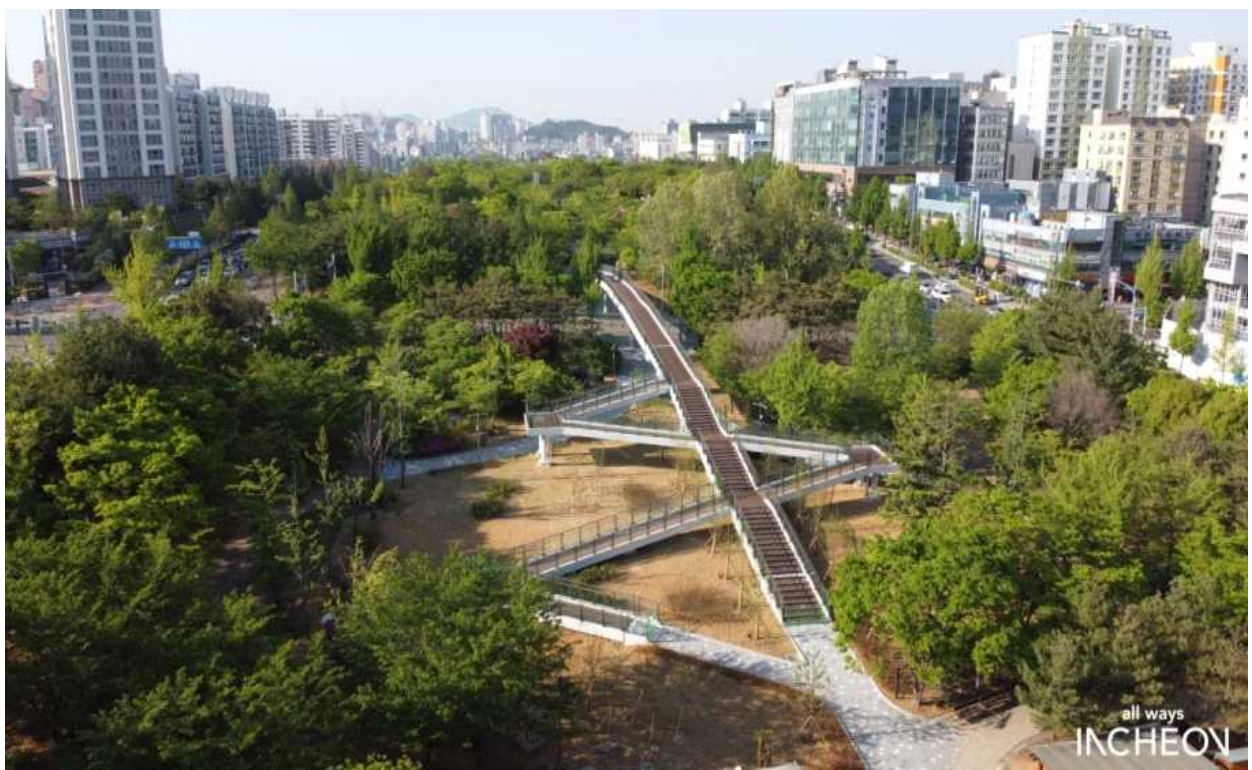
보행육교(4-5지구) [가온교] YMCA사거리