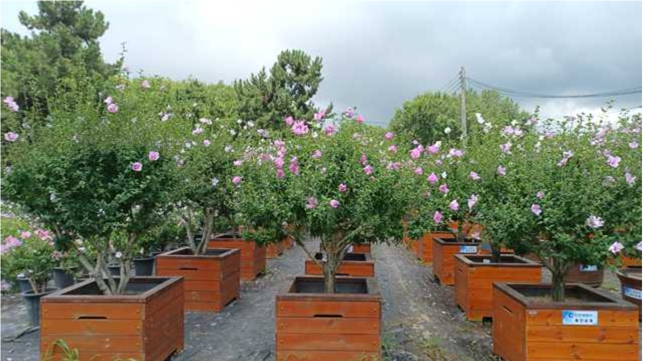
〈애플에 전시될 무궁화 분화〉