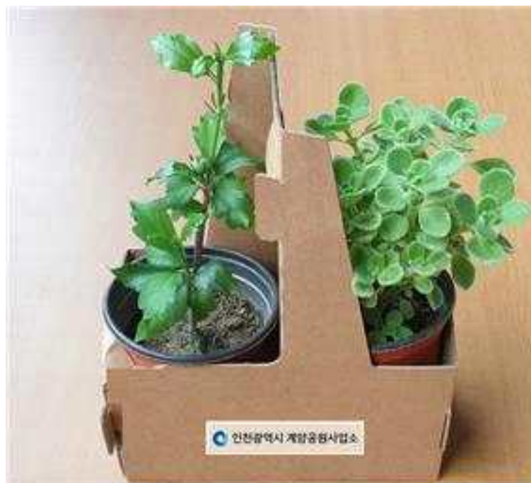
〈무료 나눔 묘목 샘플〉