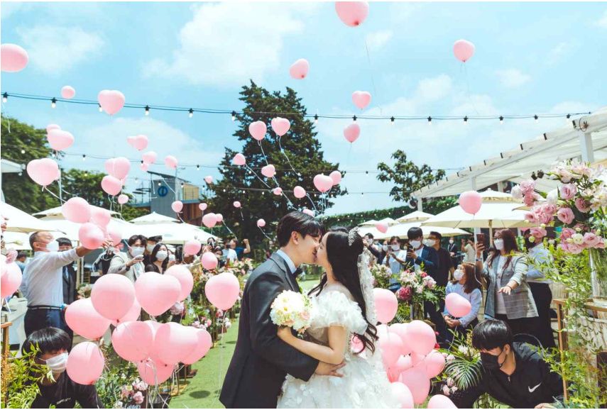
[붙임1] 인천형 작은결혼식 사진