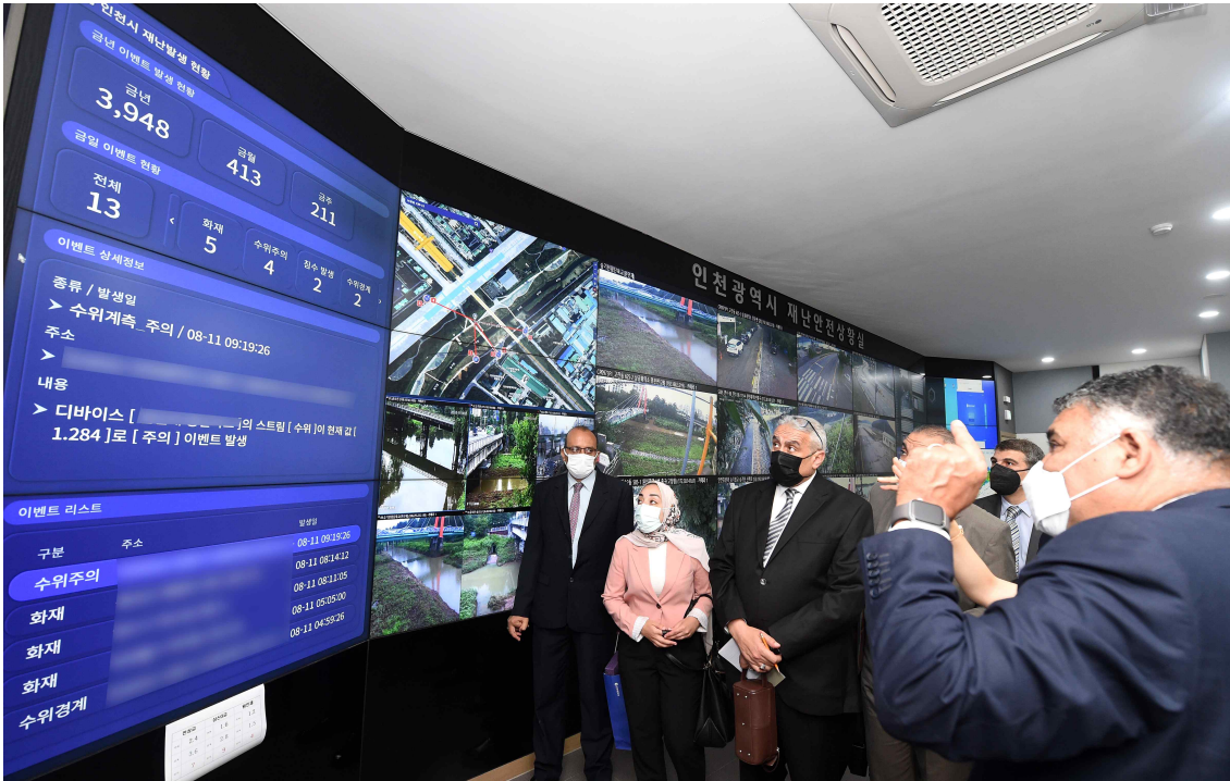
▲ 11일 시청에서 이집트 삼 엘 세이크시 대표단이 재난안전상황실을 견학하고 있다.