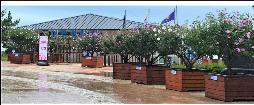
단체부문 동상을 수상한 인천광역시 무궁화 작품