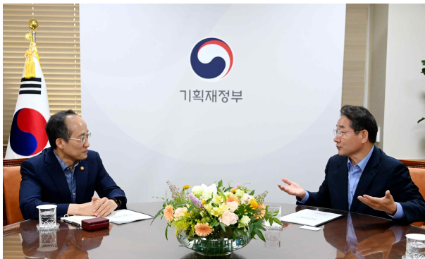
▲ 지난 7월 9일 유정복 인천시장의 추경호 경제부총리를 면담을 갖고, 2023년도 주요사업에 대한 국비 지원 등을 요청했다.