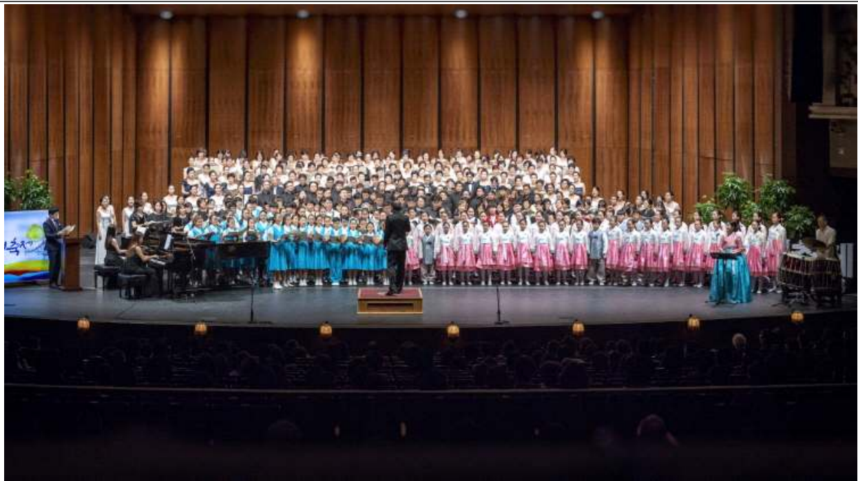
인천합창대축제 공연 사진