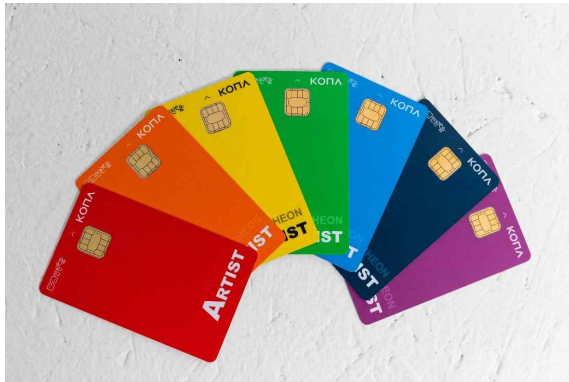
인천 예술인 이음카드