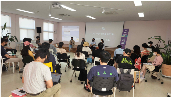
서로지원 매칭데이 : 인천 지역 예술인의 장르·영역간 협업을 도모하는 <예술인 서로지원사업>의 지원자들이 공개 PT로 이루어지는 심의 방식에 참여하고 있다.