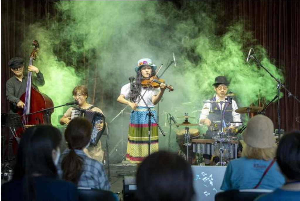
살롱콘서트 후 공연사진