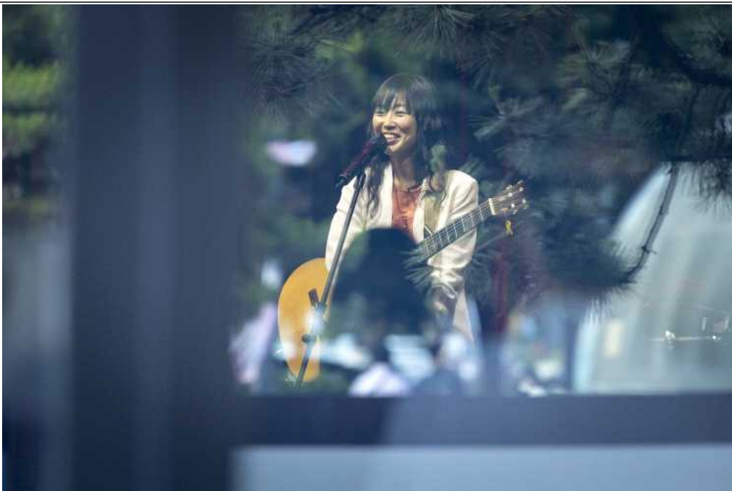
살롱콘서트 휴 공연사진