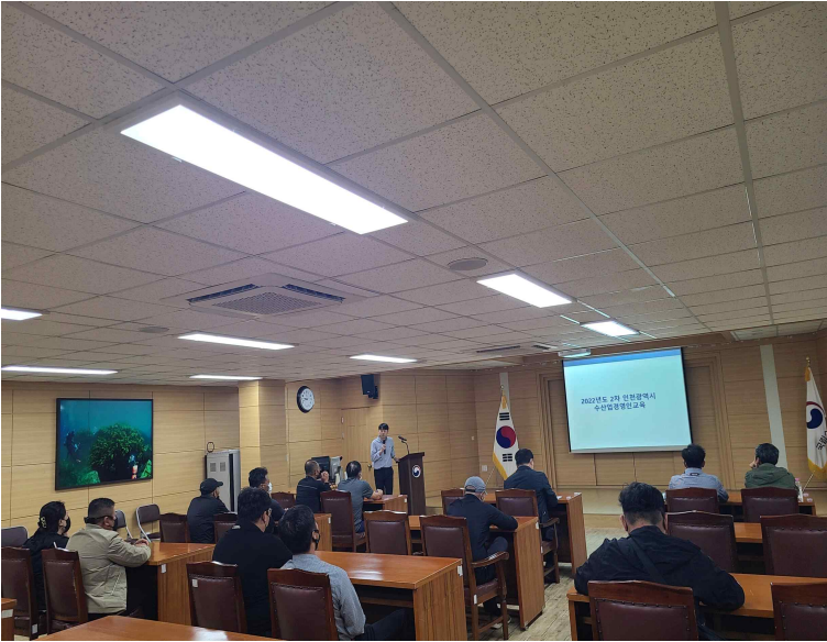
사진 3. 국립수산물과학원 동해수산연구소 견학