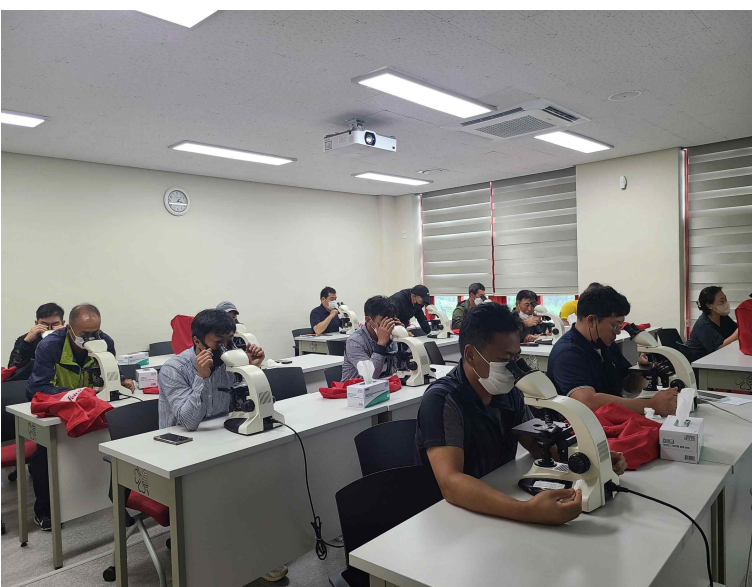
사진 2. 강릉원주대학교 해양과학교육원에서 부유생물 현미경 관찰