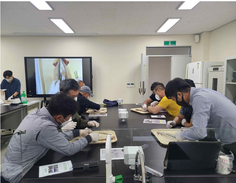
사진 1. 강릉원주대학교 해양과학교육원에서 오징어 해부 실습