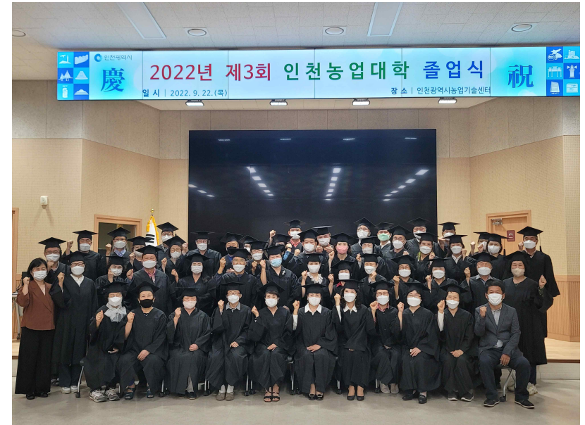
[인천농업대학 졸업식 사진]