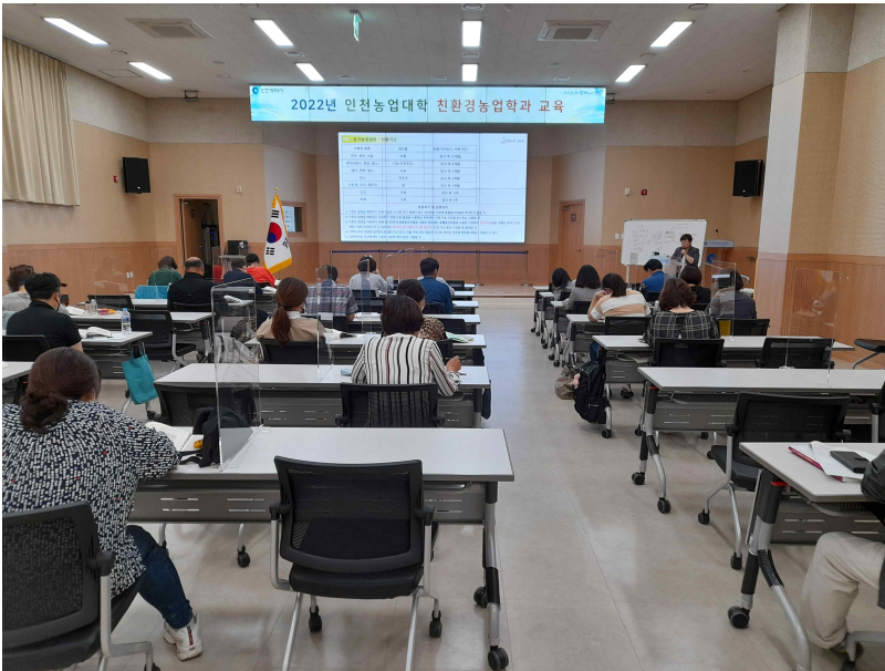
[인천농업대학 친환경농업학과 교육 사진]