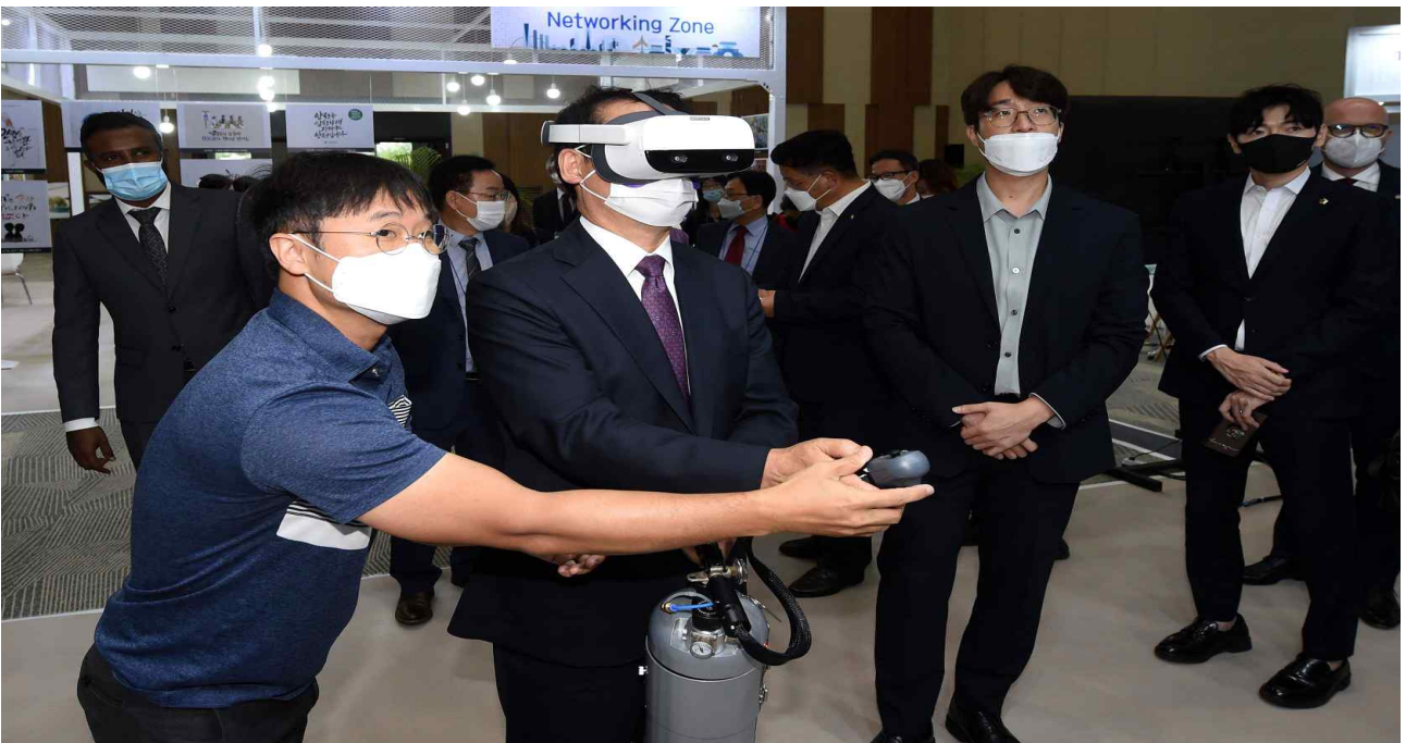
유정복 인천광역시장이 28일 송도 컨벤시아에서 열린 '2022 인천 재난안전전시회'에서 소화기를 체험하고 있다.