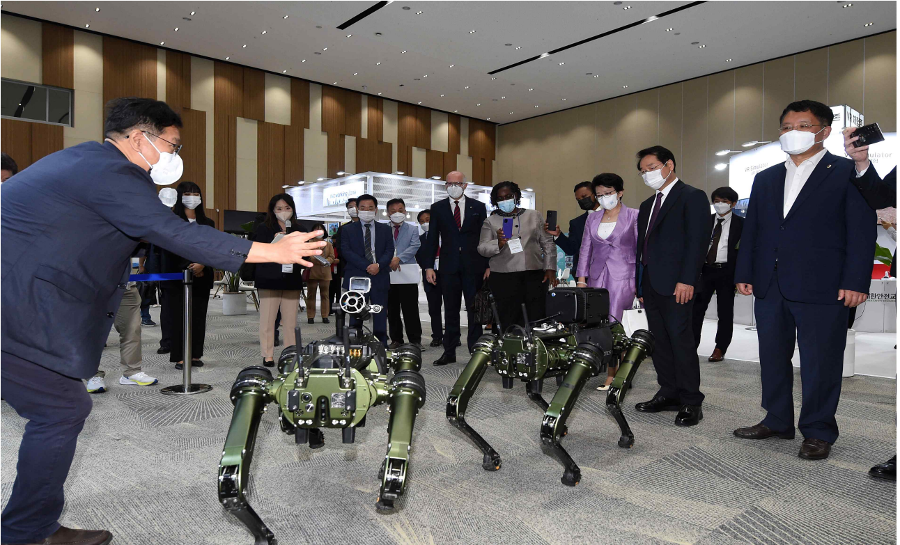
[유정복 인천광역시장이 28일 송도컨벤시아에서 열린 '2022 인천 재난안전전시회'를 관람하고 있다.]