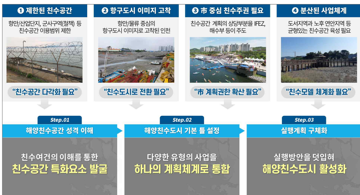
[그림 1-1] 과업의 배경 및 목적