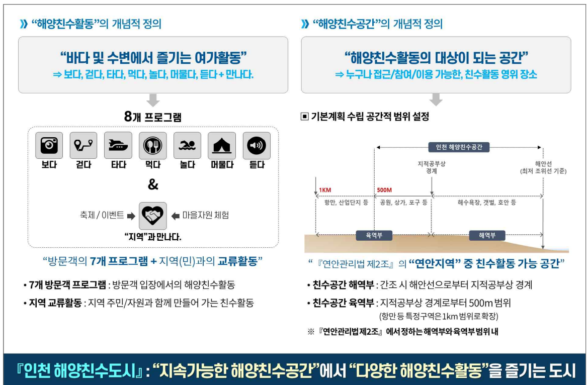
[그림 1-3] 개념적 정의