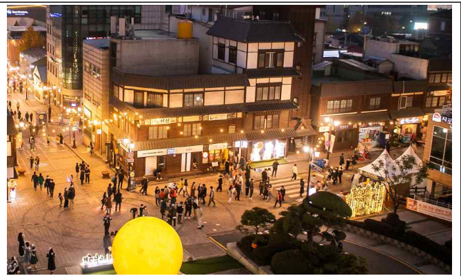
< 개항장 문화재 야행 전경 >