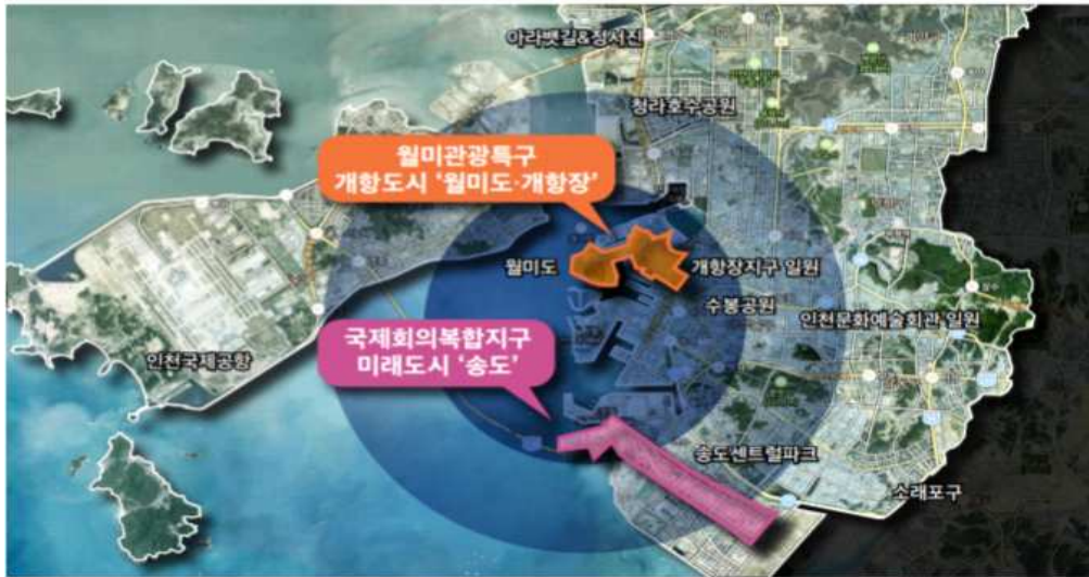
< 인천 야간관광벨트 조성사업 위치도 >