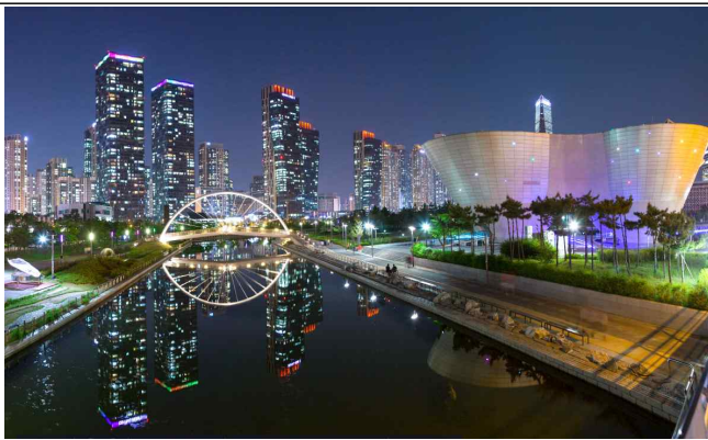
< 송도센트럴파크 야경 >