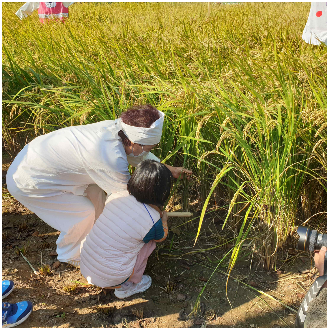
<불임> 2022년 월미공원 벼 베기 농경체험 행사 사진