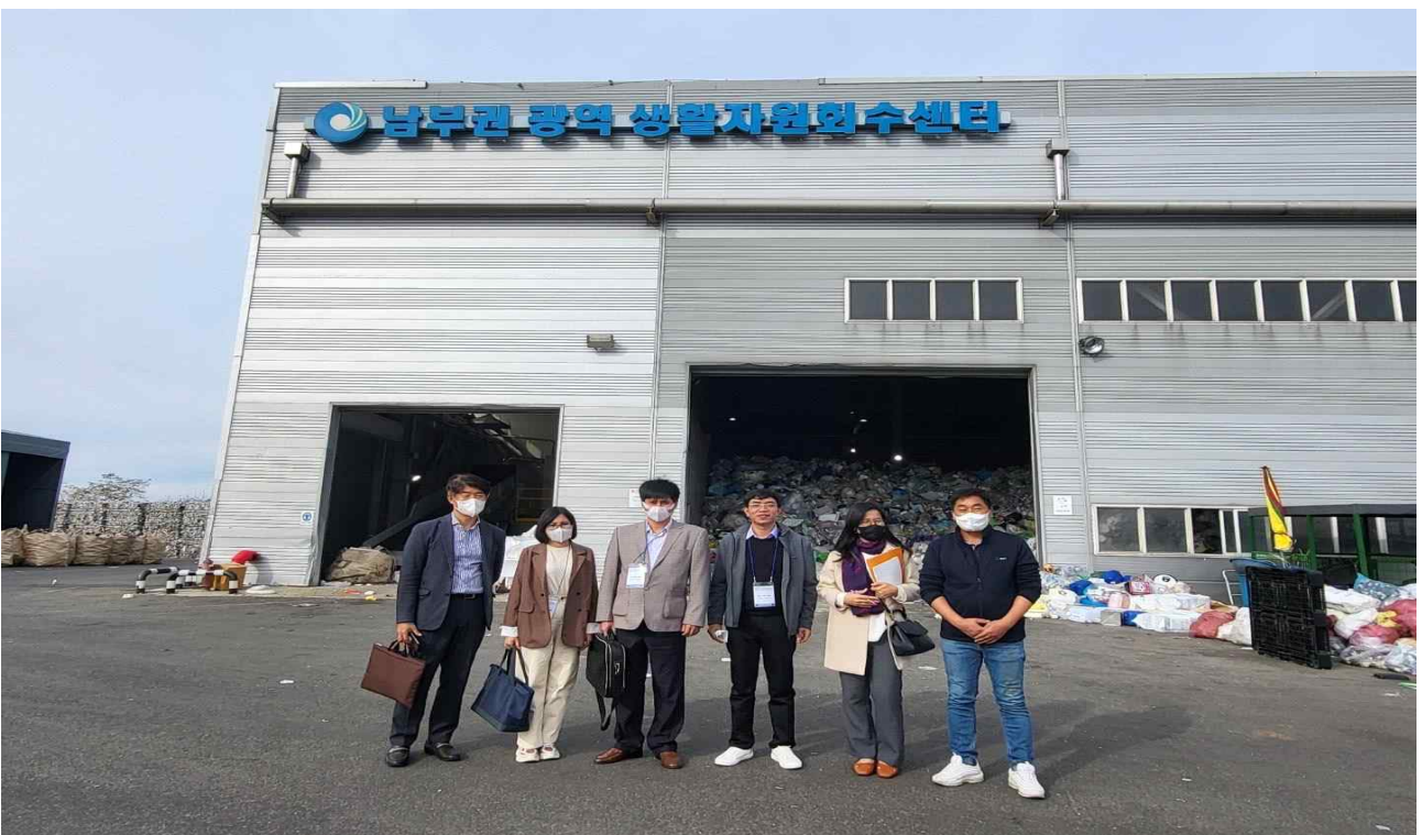
10.26 남부권 광역 생활자원회수센터