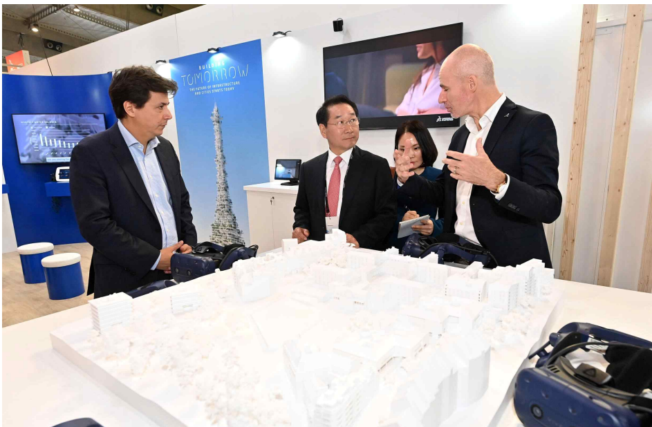
▲유정복 인천광역시장의 15일(현지시간) 스페인 바르셀로나에서 열린 '2022 스마트시티 엑스포 월드콩그레스(SCEWC)'에서 홍보부스를 둘러보고 있다.