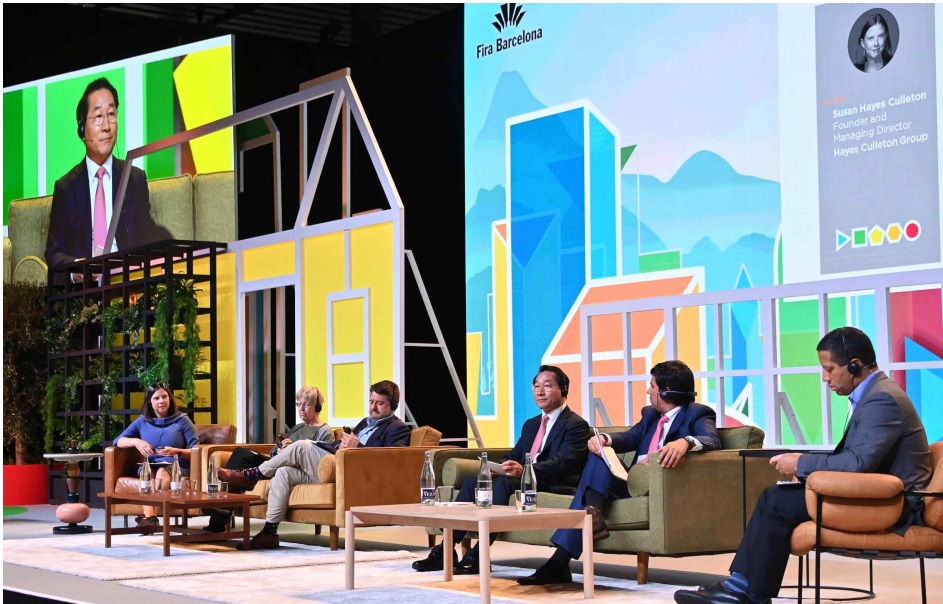
▲유정복 인천광역시장의 15일(현지시간) 스페인 바르셀로나에서 열린 '2022 스마트시티 엑스포 월드콩그레스(SCEWC)'에서 '협력적 거버넌스를 통한 미래사회 공유'라는 주제로 토론을 하고 있다.