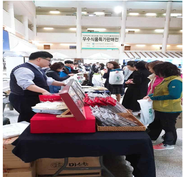
<2019년 진행한 인천우수식품특별판매전 사진 >