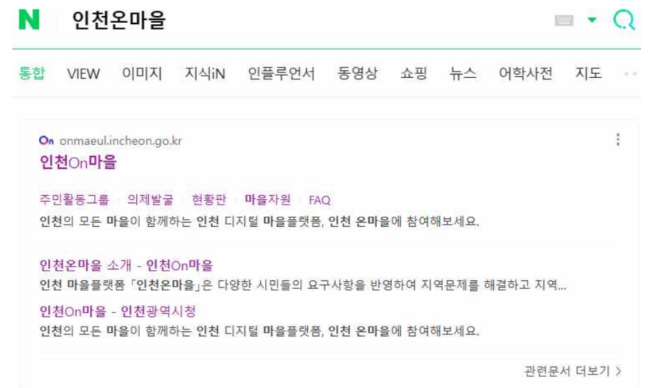
[인천온마을 네이버 검색]