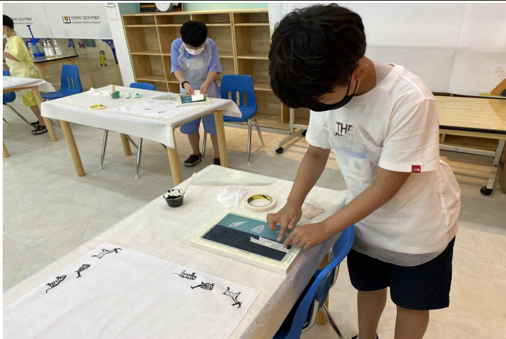
사진 2. 실크 스크린 수업