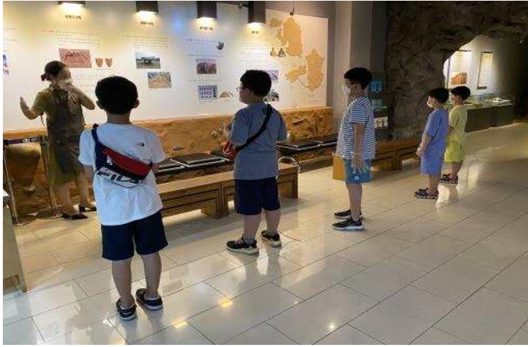
사진 1. 상설 전시 설명