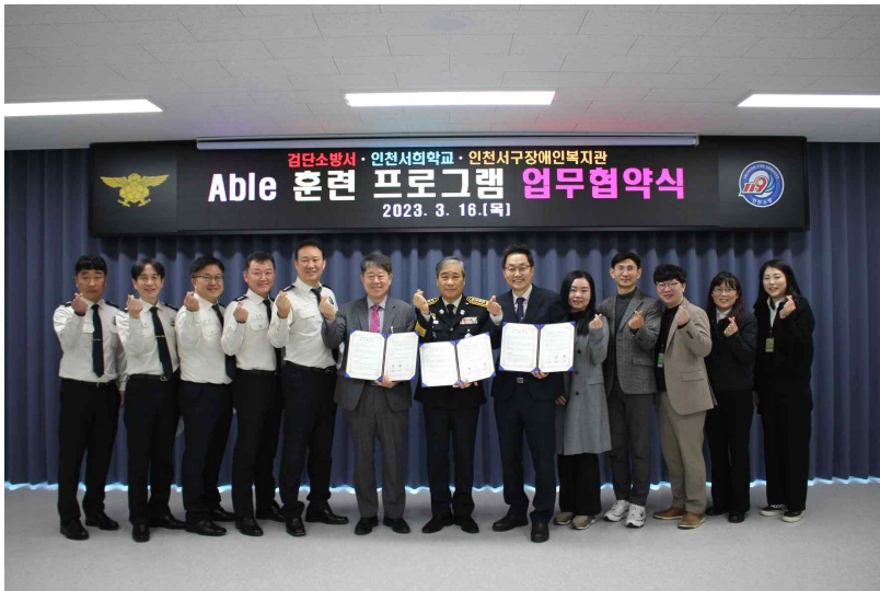
<2023년 3월 16일 인천검단소방서 · 서희학교 · 서구청장애인종합복지관의 Able 훈련 프로그램 업무협약식>