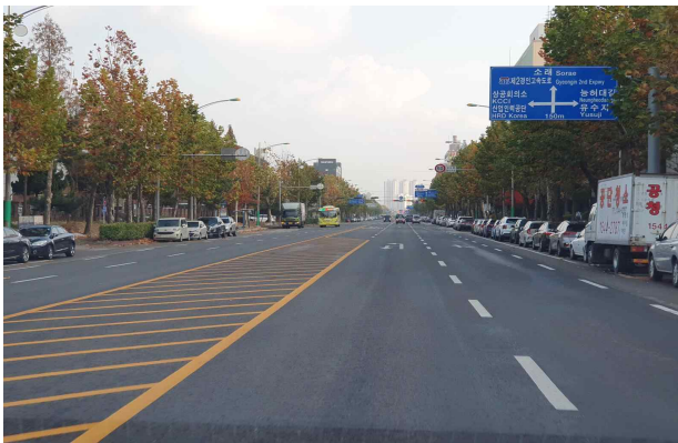
[연수구 송도동 랜드마크로]