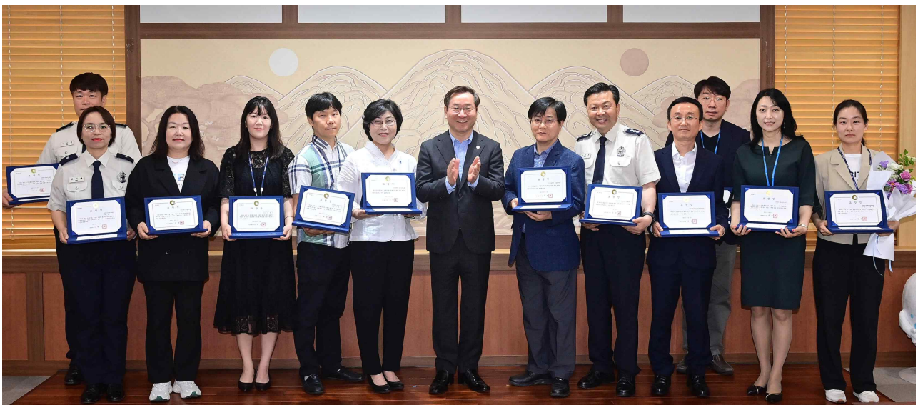
▲ 유정복 인천광역시장이 2일 시청 대접견실에서 열린 '자율적 내부통제 및 청렴마일리지 표창장 수여식'에서 유공 공무원들과 기념촬영을 하고 있다.

유정복 시장은 “공직자 스스로 행정의 오류를 미리 줄여 나가려는 노력과 비리발생 개연성을 사전 예방하는 것이 매우 중요하다”며 “앞으로도 시민에게 더욱 신뢰받을 수 있는 인천이 되도록 청렴문화 조성에 노력해달라”고 당부했다.