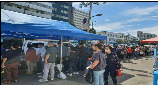
상품권 지급부스 (추석명절)