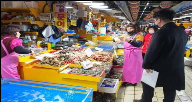
시장 내부 전경