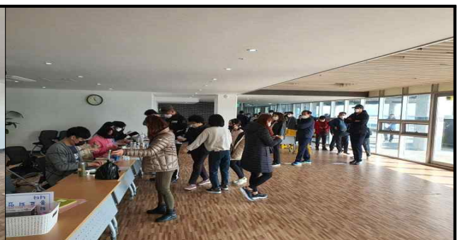
상품권 지급부스 (김장철)