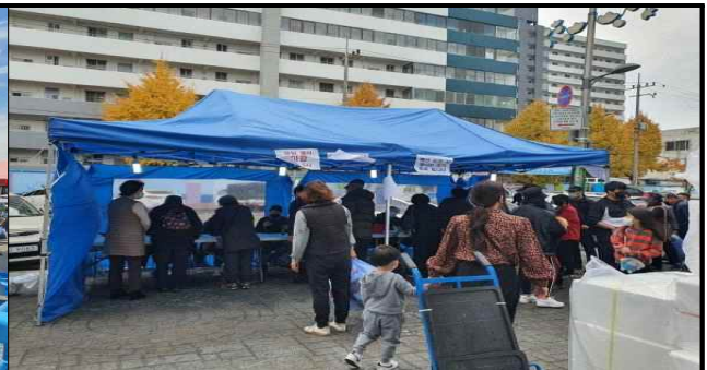
상품권 지급부스 (김장철)