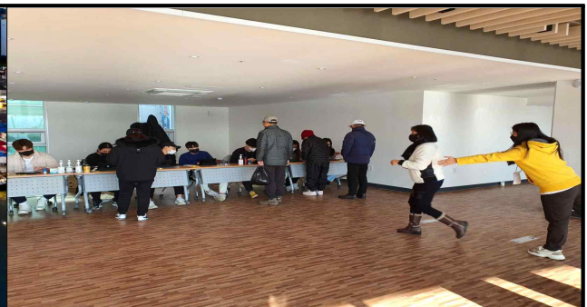
상품권 지급부스 (설명절)