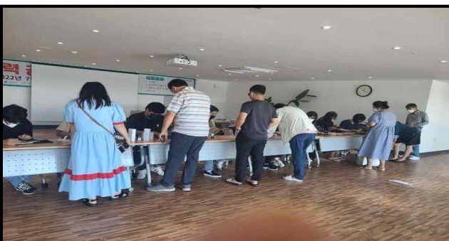
상품권 지급부스 (추석명절)