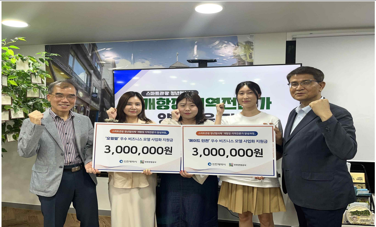
<22년도 우수 비즈니스 모델 사업화 지원금 수여>