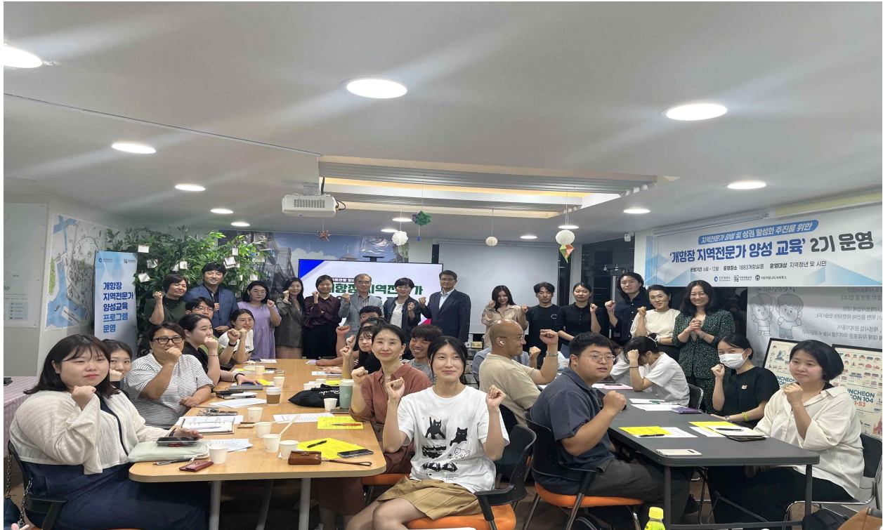
<개항장 지역전문가 양성과정> 2기 단체사진