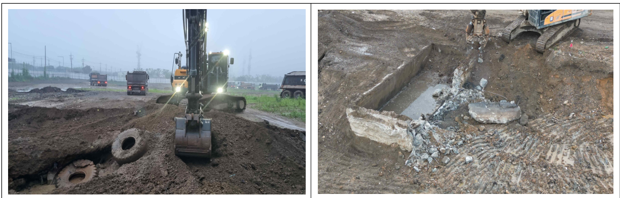
[기존 적치장 매립폐기물 처리 사진]