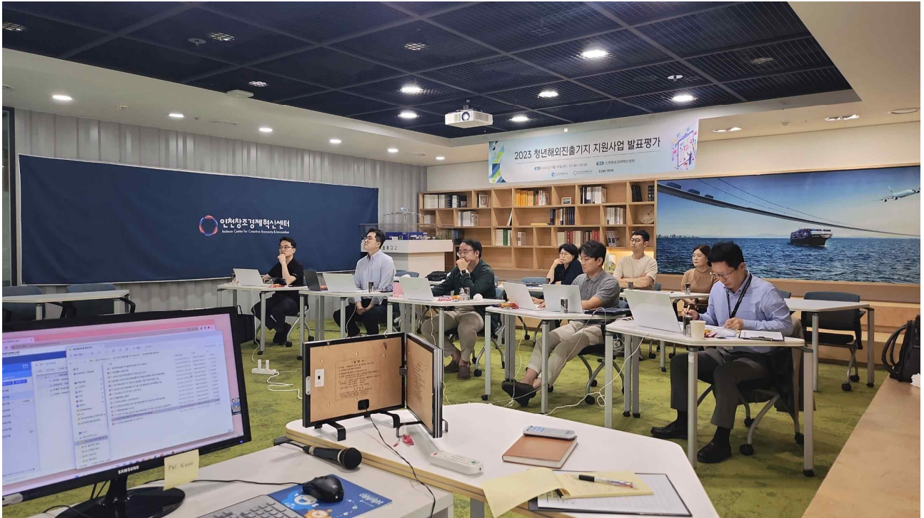
<2023년 8월 16일 청진기 지원사업 발표평가가 인천 창조경제 혁신센터에서 진행됐다.>