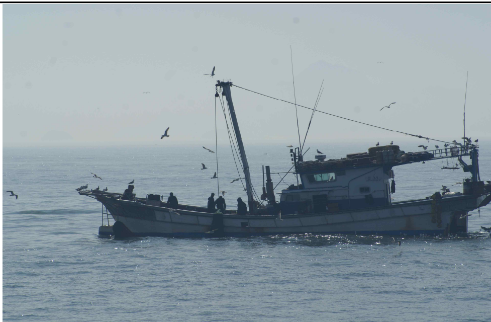
어선 조업 전경