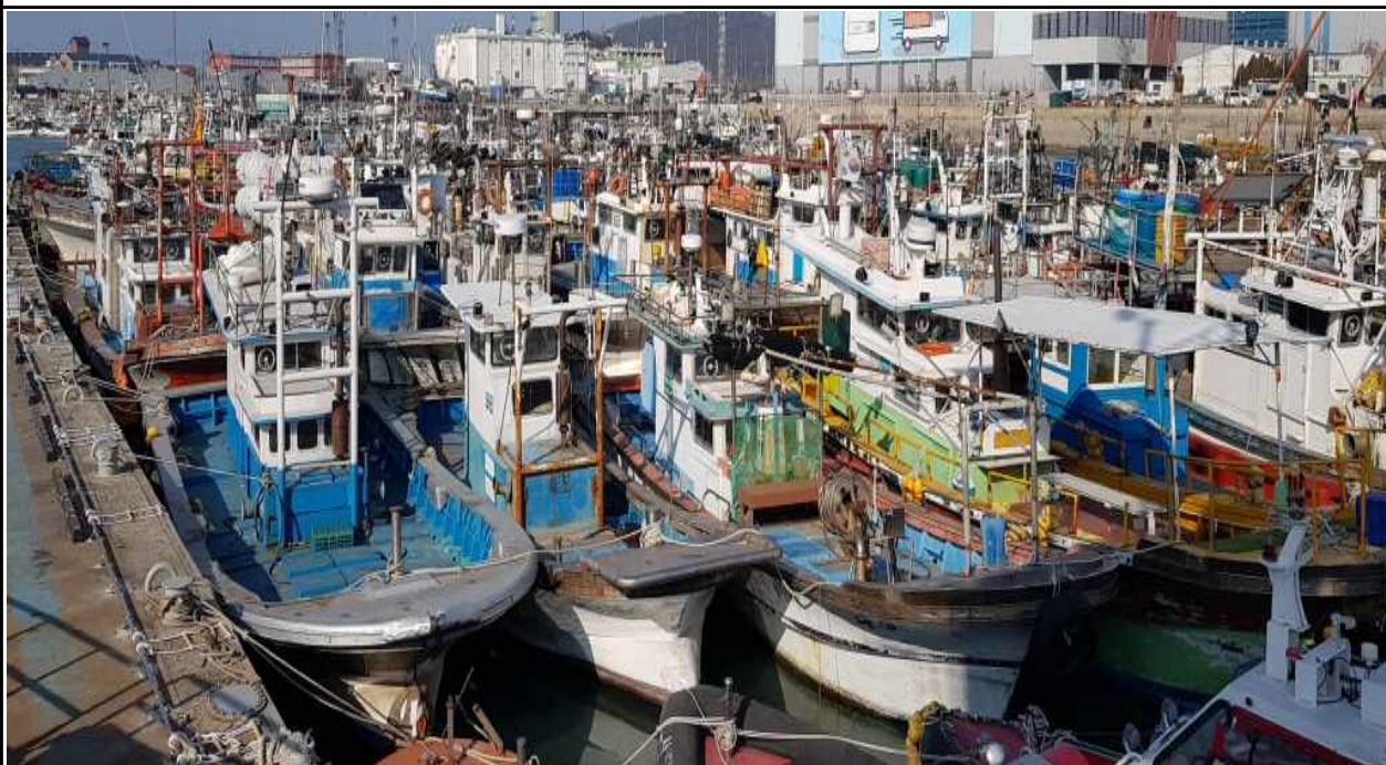
연안부두 어선 정박 전경