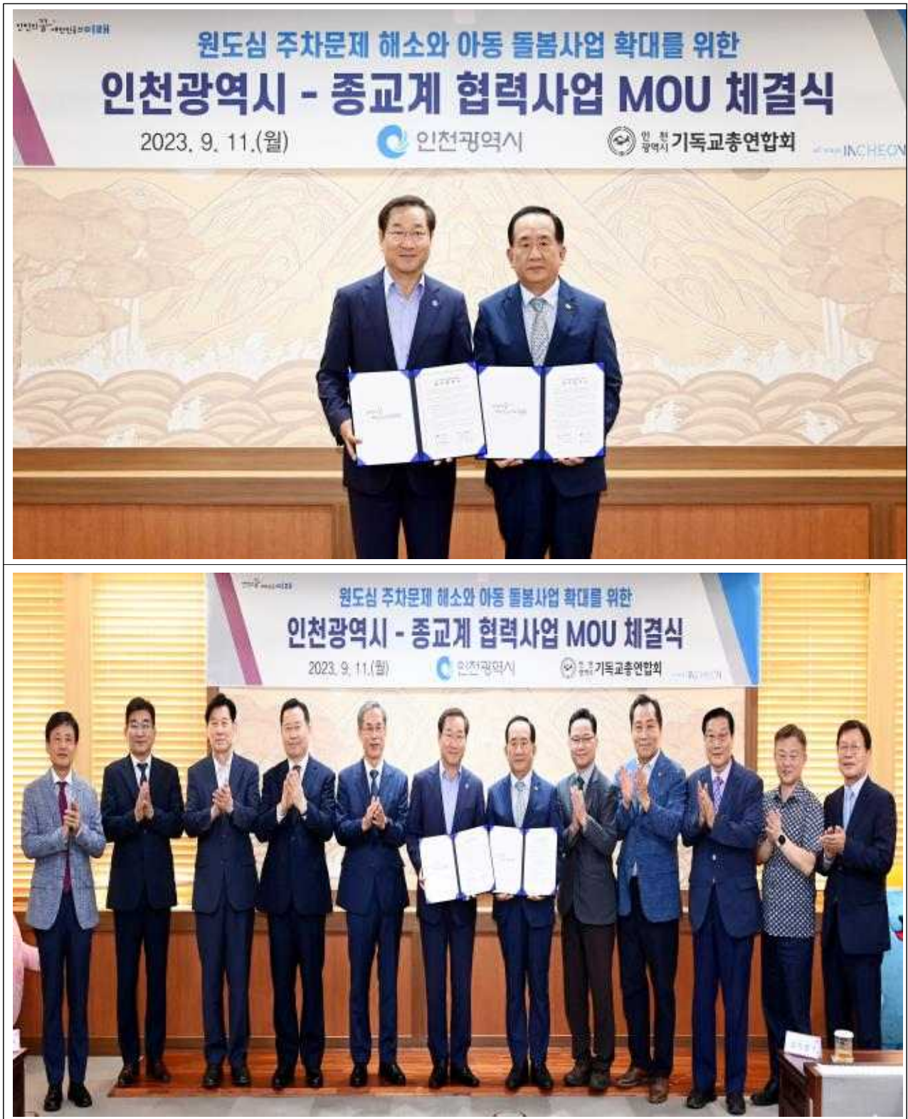
[관련사진] 2023. 9. 11. 시-인천기독교총연합회 MOU 체결